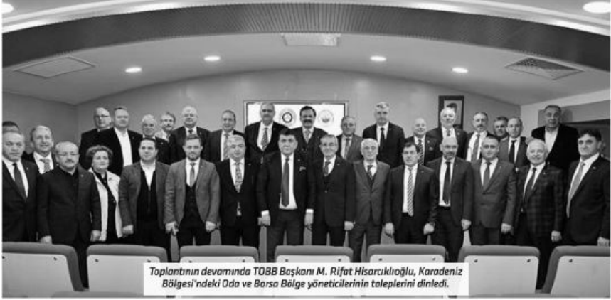
Toplantının devamında TOBB Başkanı M. Rifat Hisarcıklıoğlu, Karadeniz Bölgesi'ndeki Oda ve Borsa Bölge yöneticilerinin taleplerini dinledi.